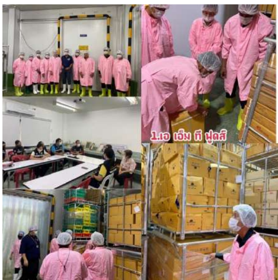
1. เอ็ม ที ฟู้ดส์