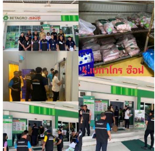
4. เต้ากร ซ็อฟ