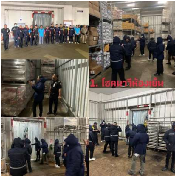
1. โชคทวีห้องเย็น