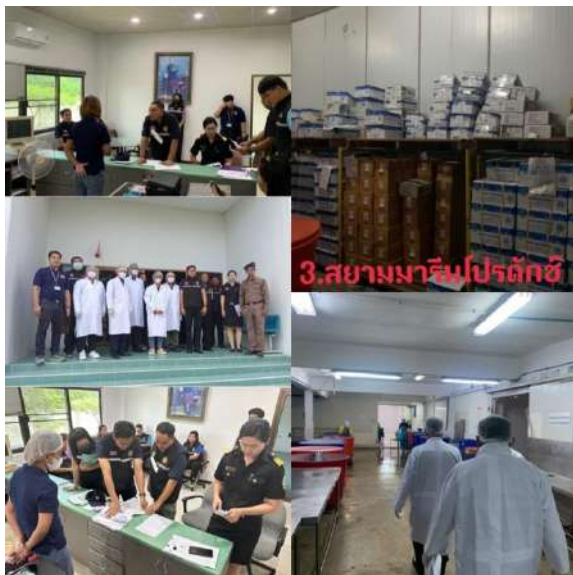
3. สยามมาริมโปรดักส์