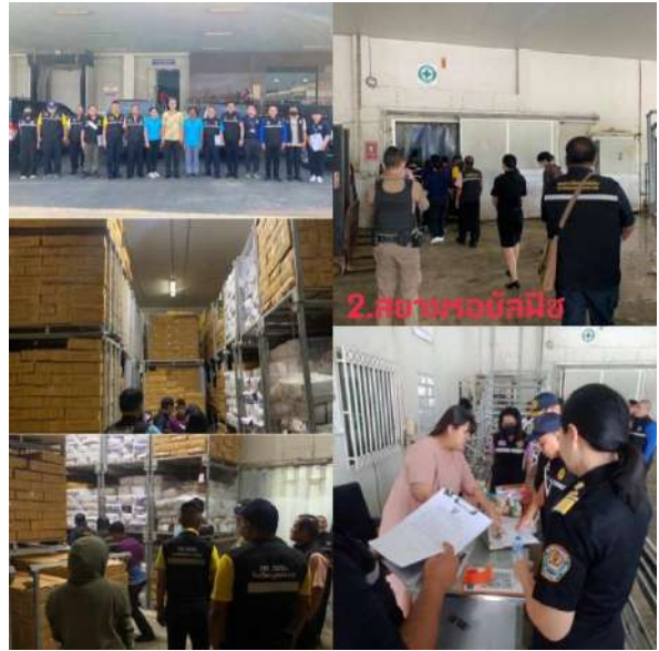
2. สยามทอซิลมีช