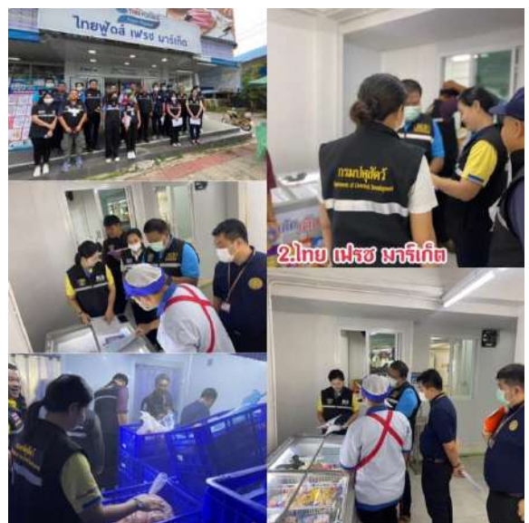
2. ไทย แฟรช มาริเกต