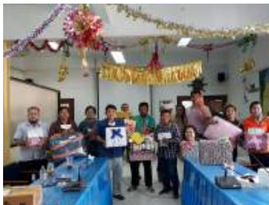
รูปที่ถ่าย จะได้ในลักษณะแบบนี้